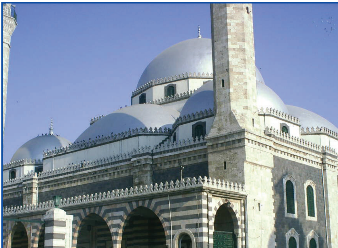
مسجد وضريح خالد بن الوليد في مدينة حمص - سوريا-